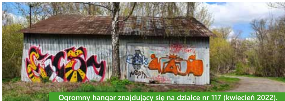
Ogromny hangar znajdujący się na działce nr 117 (kwiecień 2022).

Dokładne przyglądnięcie się zdjęciom lotniczym pozwoliło na wykrycie ogrodzenia znajdującego się między działkami nr 117 i 118 oraz działką nr 118 i działką prywatną. Nie było ono widoczne z widoku przechodnia spacerującego ul. Otwinowskiego. Można by wtedy przypuszczać, że obszar przyszłego parku obejmie jedynie teren działki nr 117. Czujne oko autora-geodety pozwoliło poszerzyć teren parku o kolejne 9 arów. Metalowe ogrodzenie było spójne z ogrodzeniem sąsiedniej prywatnej działki i trudno było dostrzec wewnętrzne ogrodzenie pomiędzy działką prywatną a działką miejską. Działka nr 118 była przez lata zamknięta i niedostępna dla mieszkańców. Prawdopodobnie to dzięki złożonemu projektowi