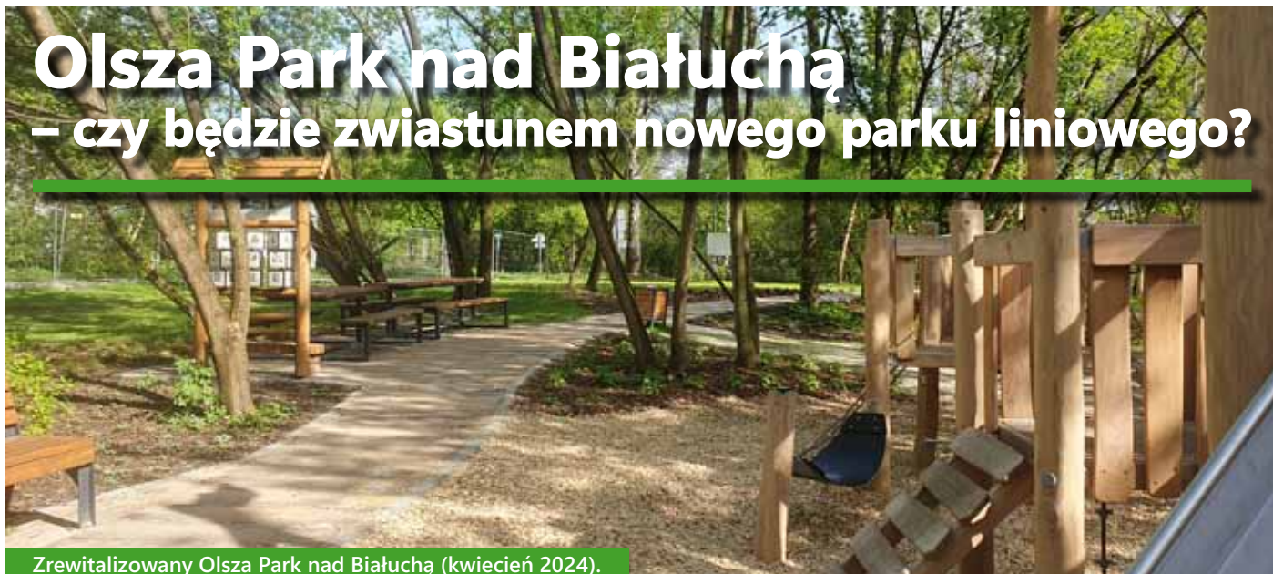
Zrewitalizowany Olsza Park nad Białuchą (kwiecień 2024).

Na Grzegórkach wciąż mamy szansę na spektakularny park liniowy łączący znaczną część miasta. Mógłby się ciągnąć ponad 4 kilometry wzdłuż rzeki Białuchy, a także w miejscu dawnej linii kolejowej. Przekształcenie tych terenów w ogólnodostępną, przyjazną przestrzeń, pozwoliłoby połączyć odizolowane barierami okolice, a także swobodnie wędrować między przylegającymi do tej trasy parkami i skwerami: Parkiem Grzegórzeckim, Parkiem przy Fabrycznej i niedawno otwartym Olsza Park nad Białuchą, którego historię opisujemy w niniejszym artykule.