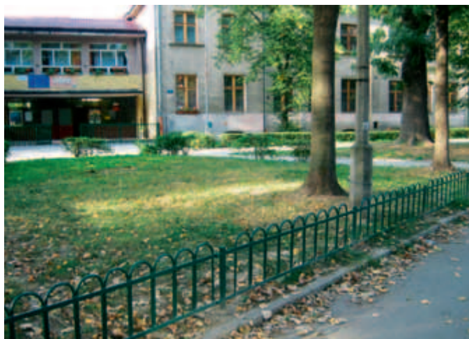
skwer przed Gimnazjum Nr 7

Aby ochronić trawnik na skwerze przed Gimnazjum Nr 7 zostało zamontowane ogrodzenie, podobnie jak na trawniku przy ul. Kordylewskiego, przy wjeździe od al. Pokoju.