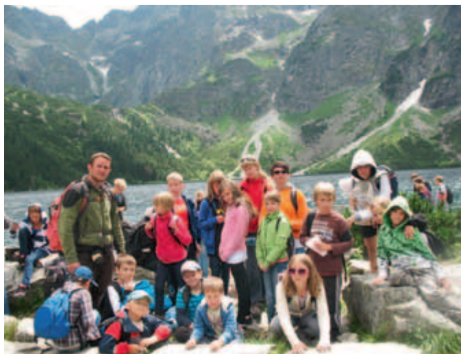
Wycieczka nad Morskie Oko – kolonia letnia Białka Tatrzańska

Podczas tegorocznych wakacji wiele się działo. Również i u nas. Na koloniach sportowo-tanecznych zorganizowanych przez Stowarzyszenie Aktywny Wypoczynek – Grzegórzki odpoczywało i bawiło się ponad sto dzieciaków z Grzegórek i nie tylko. W lipcu – w górach w Białce Tatrzańskiej, w sierpniu zaś nad morzem w słonecznej, ale jednak zimnej w tym roku Ustce.