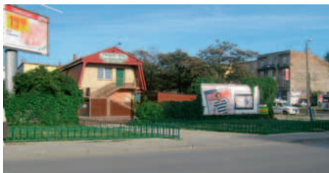
zieleniec ul. Kordylewskiego

Zrehabilitowaliśmy teren zielony przy ul. Sądowej 1 (zlikwidowany chodnik i piaskownicę zamieniono na trawnik) oraz trawnik przy ul. Daszyńskiego 11, gdzie nasadziliśmy również nową roślinność. Zamontowaliśmy 30 ławek w parku Dąbie oraz 4 przy ul. W. Wyrwińskiego.