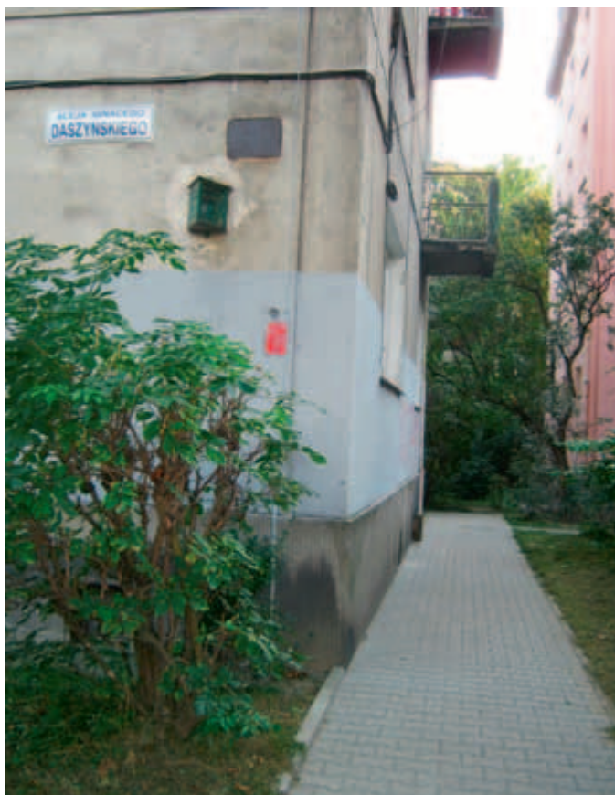
al. Daszyńskiego 22