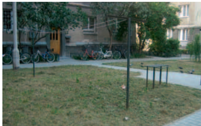
ul. Metalowców 1

Wymieniliśmy na bezpieczną nawierzchnię w ogródku jordanowskim przy al. Daszyńskiego. W ogródku przy ul. Kieleckiej została poszerzona bezpieczna nawierzchnia oraz zamontowaliśmy karuzelę tarczową i sprężynki. Dodatkowe sprężynki zostały zamontowane także w ogródku przy ul. Fabrycznej i ul. Bobrowskiego.