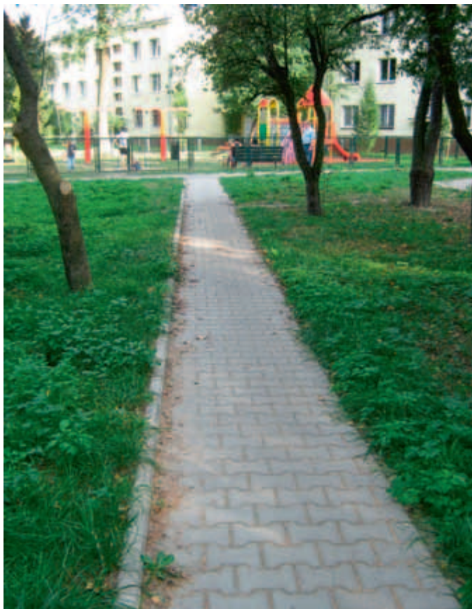
ul. Bobrowskiego (okolice ogródka)