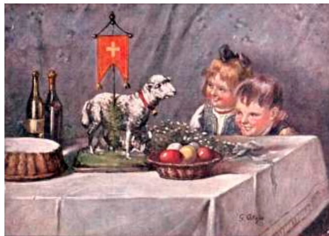
Pocztówka z lat 30. XX w. – aut. G. Ostoją – ze zbiorów autora

Przepisy podane zostały w oryginalnym brzmieniu, ale mam nadzieję, że ich wykonanie nie sprawi żadnych trudności, a niewątpliwe walory historyczno-smakowe przyniosą wiele radości i przyjemności w trakcie przygotowania i degustacji. Smacznego.