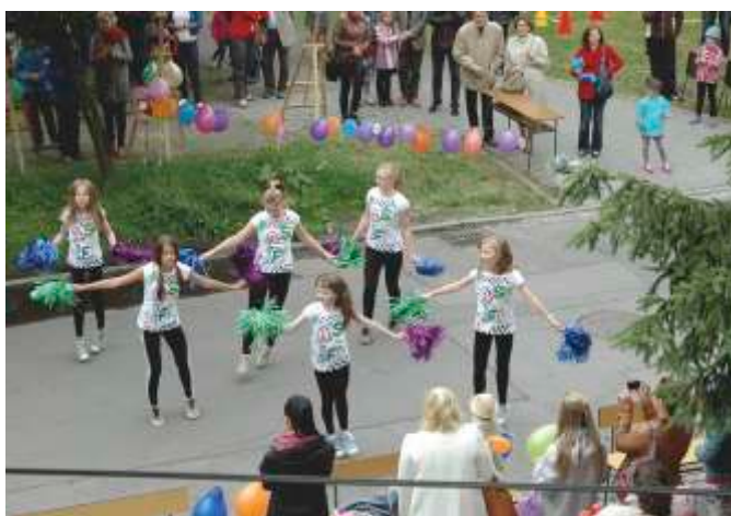
Festyn KDK „Powitanie Lata”

Podczas dwudniowej wycieczki autokarowej uczestnicy zwiedzili Krasiczyn – siedzibę rodu Sapiehów, a także Przemysł, Kalwarię Paclawską i Arboretum w Bolestraszczykach.