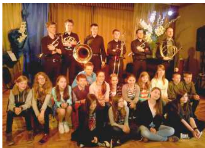
Koncert edukacyjny dla młodzieży „W blasku instrumentów dętych” w wykonaniu uczniów Zespołu Szkół Muzycznych im. M. Karłowicza w Nowej Hucie

Dzieci mogły uczestniczyć w koncercie „Tęczowej muzyki”, koncertach edukacyjnych, obejrzeć dwa spektakle teatralne, występy zespołów muzycznych i tanecznych. Wiele radości przyniósł najmłodszemu festyn na „Powitanie Lata”.