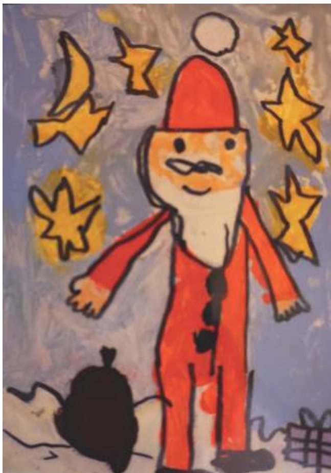
Agnieszka Pomierny, lat 5