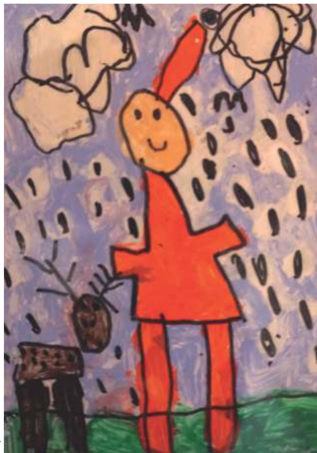
Maja Otowska, lat 5