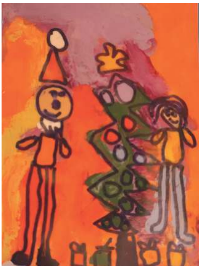
Nikola Włodarczyk Zaręba, lat 7