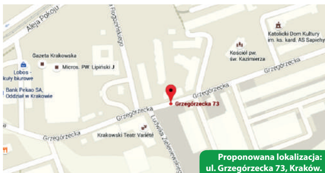
Proponowana lokalizacja: ul. Grzegorzeczka 73, Kraków.

Sprawa dalszych losów Niepublicznego Zakładu Opieki Zdrowotnej Centrum Promocji Zdrowia, czyli przychodni przy al. Pokoju 2 budzi bardzo duże zainteresowanie wśród mieszkańców naszej dzielnicy. Radni Grzegórzek cały czas mieli nadzieję, że Urząd Marszałkowski wywiąże się ze swojej obietnicy znalezienia odpowiedniego lokalu w pobliżu dotychczasowej siedziby Przychodni. Niestety, wskazane przez urzędników pomieszczenia przy ul. Śniadeckich zupełnie nie nadają się do prowadzenia tego typu działalności – są pozbawione windy i jakiegokolwiek ogrzewania.