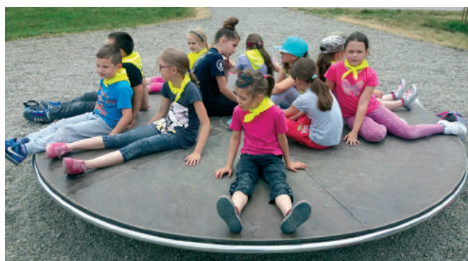
Zdj.1 Ogród Doświadczeń im. Stanisława Lema

Wakacje w mieście również mogą dostarczyć wielu atrakcji! Przekonały się o tym dzieci, które w czasie letnich ferii wzięły udział w kolejnej edycji akcji LATO W SZKOLE w Szkole Podstawowej z Oddziałami Integrycyjnymi nr 3 przy ul. Topolowej. Program opierał się na zajęciach rekreacyjno-sportowych oraz zwiedzaniu ciekawych miejsc. Uczestnicy akcji aktywnie spędzali czas na placach zabaw, w parkach (m.in. w Parku Lotników, Parku Jordana) lub historycznych obszarach miasta (Kopiec Krakusa, Bulwary Wiślane). Korzystali także z różnych zajęć sportowych (basen, sala gimnastyczna, kręgle, siłownia) w ośrodku KSOS-u. Uczniowie zdobywali również nowe doświadczenia - odwiedzili m.in. pizzerię Dominium, gdzie mogli zobaczyć, jak wykonuje się pizzę, czy Ogród Doświadczeń im. Stanisława Lema, w którym poznawali prawa przyrody. Co roku akcja „Lato w szkole” cieszy się wśród naszych wychowanków dużym powodzeniem. W ciągu czterech tygodni w programie wzięło udział łącznie 105 dzieci oraz 16 nauczycieli. Kolejna moc atrakcji będzie czekała na dzieci w następnej edycji programu ZIMA W SZKOLE. Do zobaczenia!