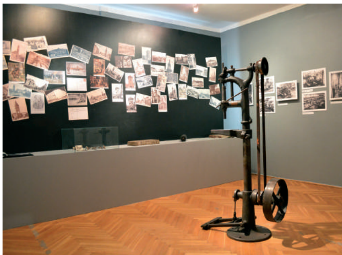
fot. Filip Szczurek

Od 23 września 2016 r. do 26 lutego 2017 r. w Domu Zwierzynieckim, oddziale Muzeum Historycznego Miasta Krakowa, trwa wystawa o Grzegórkach. Muzeum przy ul. Królowej Jadwigi, oprócz tematów zwierzynieckich, podejmuje również kwestie związane z dawnymi przedmieściami Krakowa, ich specyfiką i kulturą. W ramach cyklu Zwierzyniec zaprasza przedstawiane są dawne podkrakowskie wsie, które w pierwszej połowie XX w. zostały przyłączone do Krakowa. Do tej pory odbyły się wystawy o Krowodrzy i Dębnikach, a następne planowane dotyczą Rakowic i Prądnika Białego.