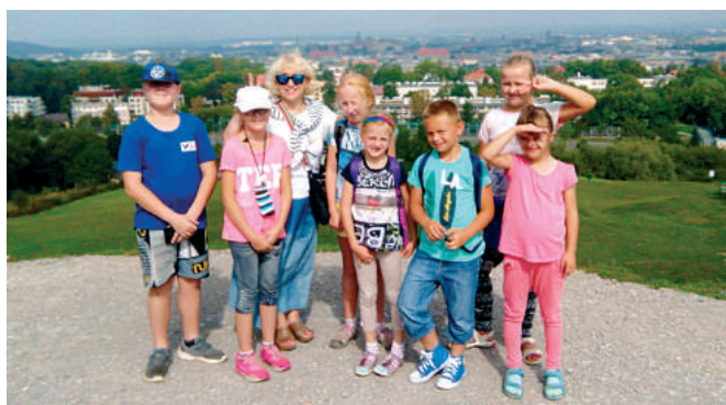
Zdj.3 Kopiec Krakusa