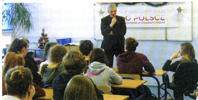
Spotkania ze Świadcami Historii