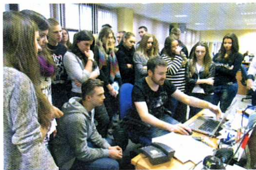
W redakcji Dziennika Polskiego