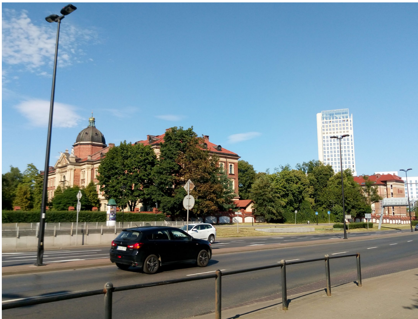
ul. Lubomirskiego, po lewej budynek UE, po prawej Unity Center