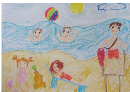
III miejsce – Kaja Nowakowska