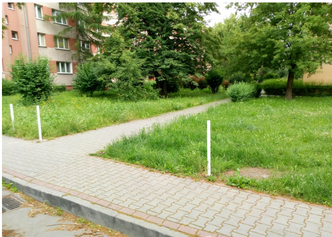
Przestrzeń na kilka miejsc parkingowych, ul. Jachowicza