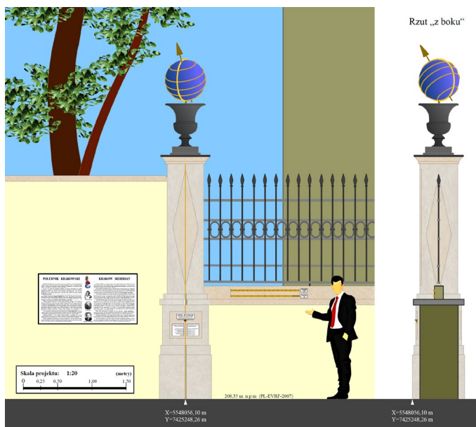
Projekt kolumny Południka Krakowskiego – Collegium Śniadeckiego

w Krakowie wynosi 0,994 metra. Formalnie jednak, krakowski południk zerowy wytyczony został dopiero w 1792 roku, wraz z inauguracją pierwszego państwowego obserwatorium astronomicznego w Krakowie, założonego przez słynnego astronoma, meteorologa, geografa i matematyka, Jana Śniadeckiego; siedzibą obserwatorium został gmach na terenie ogrodu botanicznego - znany dziś jako Collegium Śniadeckiego - stojący przy ulicy Kopernika, na Wesołej. To tam swoje badania prowadziły sławy polskiej astronomii, jak Kazimierz Kordylewski (odkrywca księżyców pyłowych Ziemi) czy Tadeusz Banachiewicz (twórca „rachunku krakowianów”, który jako pierwszy wyliczył orbitę Plutona). Południk krakowski pojawiał się również na licznych mapach - zarówno mapach Królestwa Polskiego z XVIII wieku, jak i mapach Krakowa w XIX wieku. Był on też podstawą dla rachunków astronomicznych, służących potem do formułowania „prognostyków astrologicznych”, zamieszczanych w popularnych w XIX wieku kalendarzach astronomiczno-gospodarczych. Z czasem, południk krakowski „zniknął”, wyparty przez południk paryski, a potem pułkowski i ostatecznie, ten z londyńskiego Greenwich. I dopiero od niedawna, pamięć o tym obiekcie zaczęła wrzacać do świadomości społecznej.