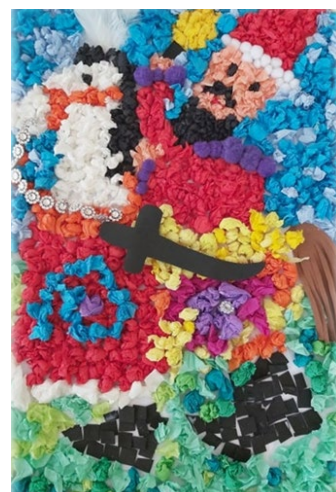
III miejsce – Emma Szkolnicka