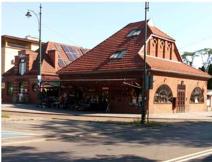
Budynek roгатki miejskiej (Rogatka Olszańska) przy ul. Rakowickiej

a wspomniany budynek zaczął pełnić funkcję gmachu reprezentacyjnego. W obrębie kompleksu budynków uniwersytetu znalazły się również mniejsze budynki, takie jak Księżówka, Domek Ogrodnika czy Stróżówka.