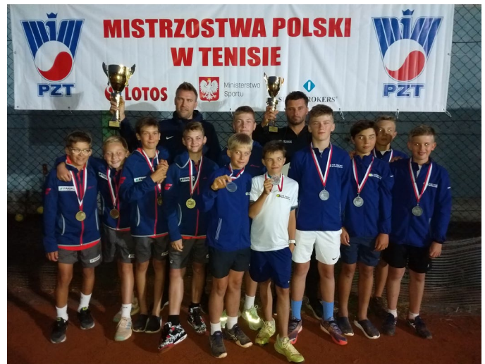
Od lewej: STT Fakro Nowy Sącz i KT Błonia Kraków

Projekt „Podróż do źródeł motywacji” został zatwierdzony do realizacji w XIII Liceum Ogólnokształcącym w Krakowie w latach 2019-2022 ze środków Programu Operacyjnego Wiedza Edukacja Rozwój (PO WER) w ramach projektu „Międzynarodowa mobilność kadry edukacji szkolnej”