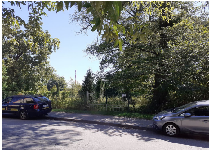
Miejsce na parking, ul. Widok

jednoznaczny wniosek – na Dąbiu jest za mało miejsc do zaparkowania i w miarę możliwości powinny być wyznaczane kolejne parkingi, tak aby zaspokoić potrzeby mieszkańców osiedla. Należy tu podkreślić, że jest to możliwe, i to bez większych szkód dla najbliższego otoczenia – wystarczy się przejść i rozejrzeć dookoła.