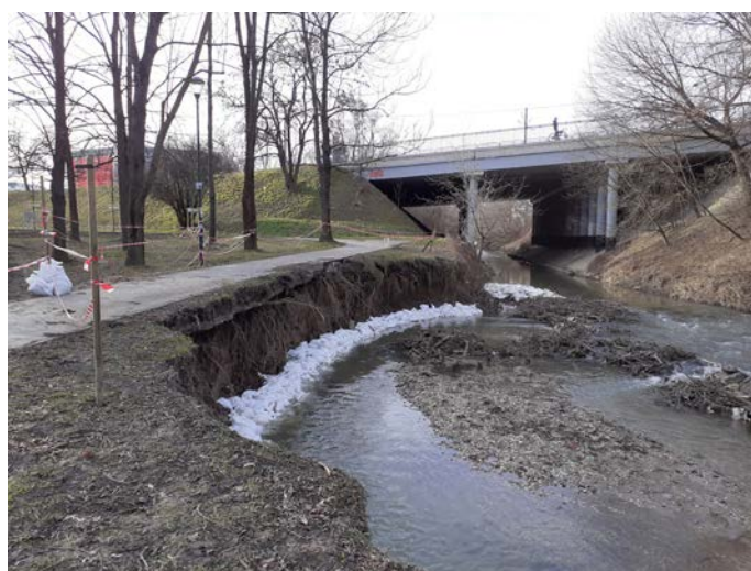
wyrwa na rzece Białucha- widok od strony Parku Dąbie