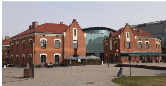
Zabudowania dawnej rzeźni miejskiej