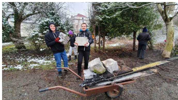
Rysunek 2 Młodzież z ZSOMS chętnie wzięła udział w akcji sprzątania. W tle budynek ZSOMS

Do akcji sprzątania włączyła się młodzież z ZSOMS (Rys. 2). Z rozmowy z młodzieżą dostrzec można pewną potrzebę utworzenia dla nich takich miejsc,