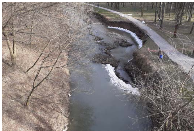
wyrwa na rzece Białucha- widok od strony Al. Pokoju