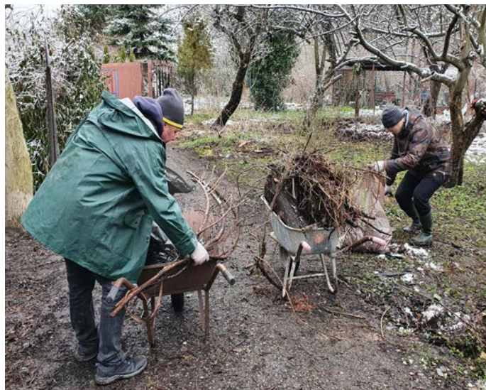
Rysunek 3 Mieszkańcy zbierający odpady zielone

Każdy wolontariusz otrzymał rękawice i słodką niespodziankę. Najwytrwalsi wolontariusze doczekali