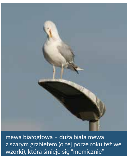
mewa białogłowa – duża biała mewa z szarym grzbietem (o tej porze roku też we wzorki), która śmieje się “memicznie”

Kiedy przechodzą spacerem nad Wisłą na terenie Grzegórzek, podziwiając lokalną przyrodę, warto na chwilę zatrzymać się i przypatrzeć trzcinom. W gęstwinach kryją się precudowne ptaki. Mieszkam na Grzegórkach od kilkunastu lat. Przyrodą interesuję się od zawsze, natomiast fotografią, zwłaszcza przyrody, dopiero kilka miesięcy i jest to moje hobby.