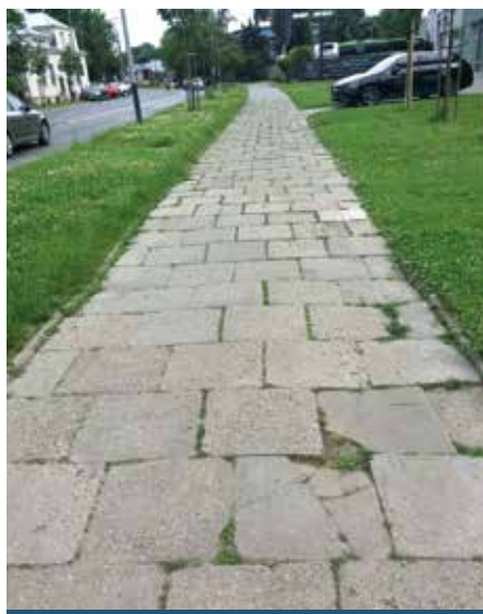
ul. Ofiar Dąbia 2b - PRZED

Abyśmy mogli chodzić po pięknych i równych chodnikach, konieczne są ich regularne remonty i naprawy interwencyjne, a te są możliwe dzięki staraniom naszych radnych. Co roku radni zgłaszają potrzeby remontowe ze swojej najbliższej okolicy, a Rada