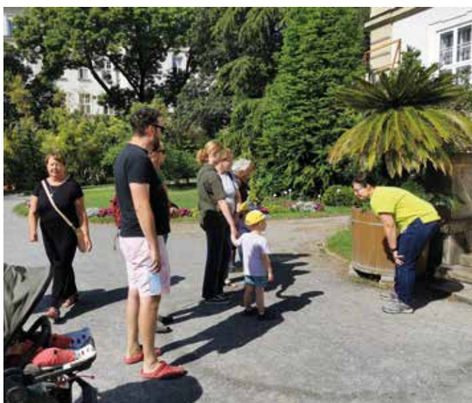
Ekospacery po Ogrodzie Botanicznym