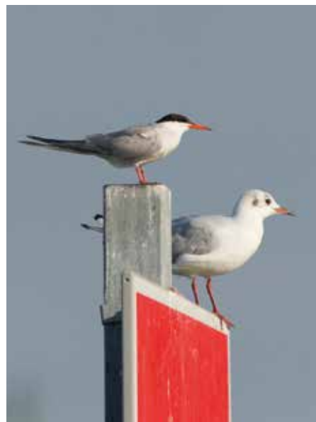
rybitwa rzeczna – mała biała z czarną czapką, bardzo zwinna mewa śmieszka – mała biała mewa, może mieć jeszcze ciapki na głowie