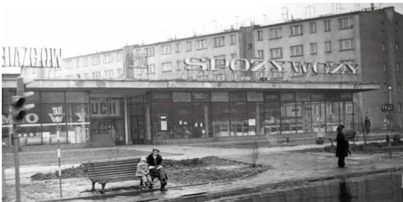
Czy poznajecie Państwo w którym miejscu wykonano to zdjęcie?

W przypadku dzielnicy takiej jak nasza, przed archiwum społecznym stoją dwa cele. Pierwszy, to notowanie i zabezpieczanie śladów przeszłości naszego obszaru, bo podlega on bardzo silnym i nieodwracalnym zmianom i tego, co teraz przepadnie, nie odtworzy się już później. Zwłaszcza, gdy wymrze starsze pokolenie. Drugi cel, to edukacja i tworzenie poczucia tożsamości obecnych mieszkańców