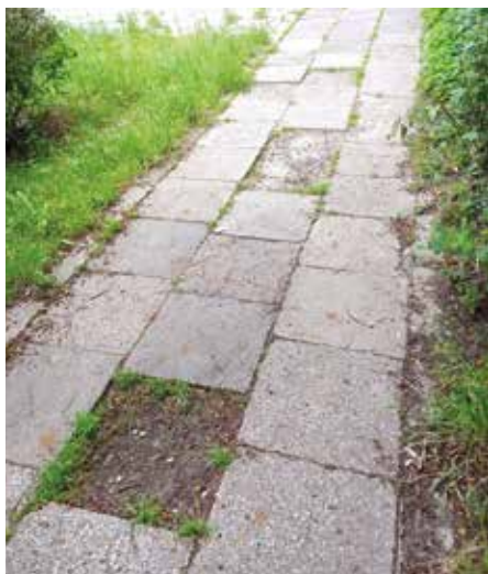
ul. Siedleckiego 13 (wewnętrzny) - PRZED