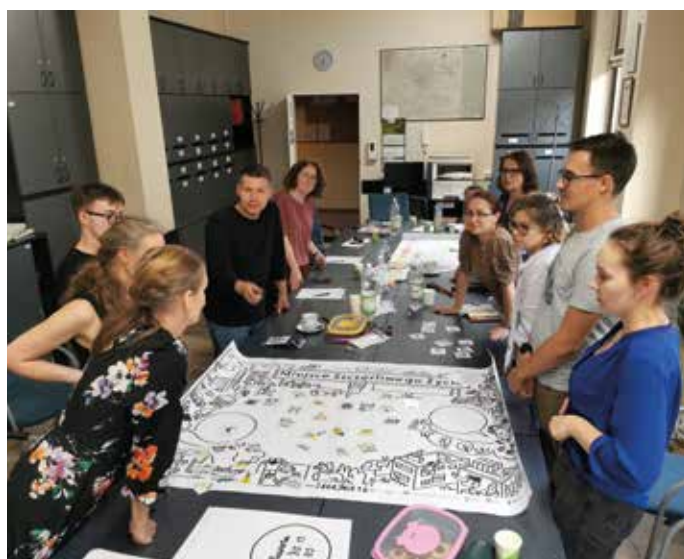
Warsztaty w ramach projektu Ambasador Rewitalizacji: Grzegórzki Wesola