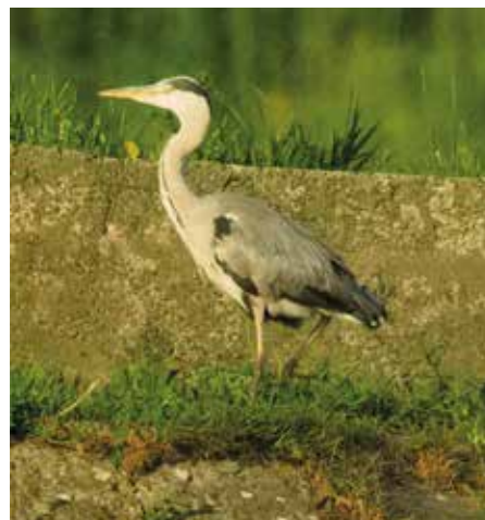
czapla siwa – duża szara czapla, często stoi albo po drugiej stronie Wisły albo na cyplu przy zaporze