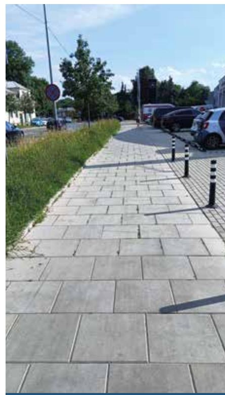
ul. Ofiar Dąbia 2b - PO