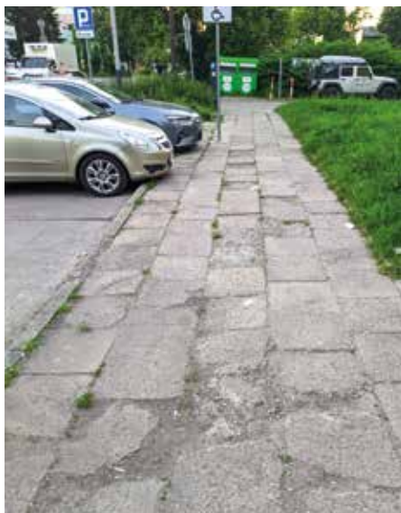
ul. Rogozińskiego 5 - PRZED