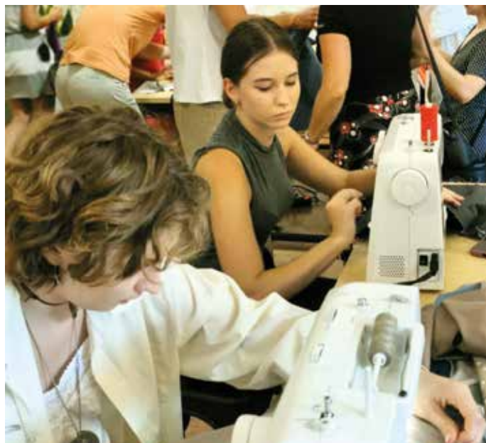
Recyclingowe warsztaty szycia toreb na lato