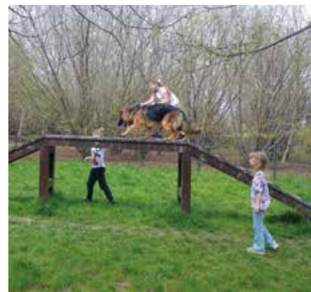
Dzieci spacerujące z psem po kładce na wybiegu płaszowskim.

W tegorocznym głosowaniu nad projektami z Budżetu Obywatelskiego zachęcamy więc do głosowania na inicjatywy związane z tworzeniem nowych przestrzeni przyjaznych psom. Aktualnie w trakcie realizacji znajduje się psi wybieg na osiedlu Oficerskim, tworzony z projektu Budżetu Obywatelskiego 2023. Stawianie na tego typu inwestycje to krok ku bardziej otwartemu i przyjaznemu środowisku miejskiemu. Przestrzenie przyjazne psom nie tylko podnoszą wartość dzielnicy w oczach