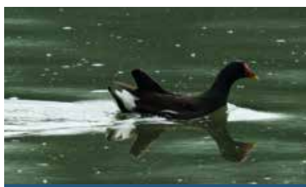
kokoszka – kurka wodna, przypomina mniejszą kaczkę, chowa się w trzcinach i boi się pokazywać, za to wydaje dziwne dźwięki