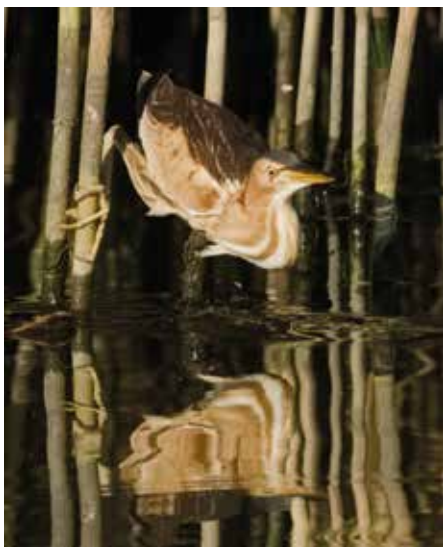
bączek – mała czapla trzymająca się trzciny jak szczudła