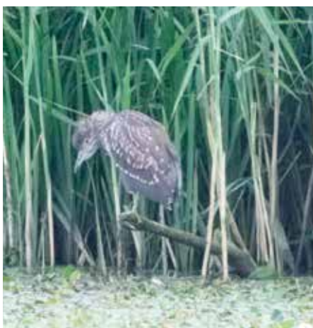
ślepowron – chyba się już wyniósł, albo lepiej chowa, średnia, smętnie wyglądająca czapla zwykle przesiadująca przed szuwarami na drugim brzegu. Lornetka się przydaje, żeby ją zobaczyć.