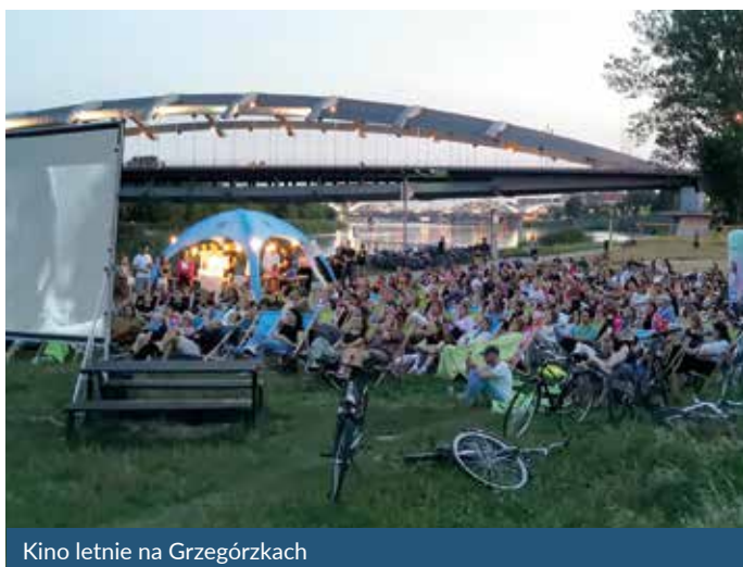
Kino letnie na Grzegórkach