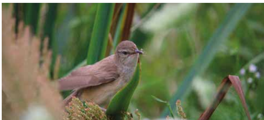
trzciniak – mały ptaszek w trzcinach, wiosną bardzo głośno śpiewa