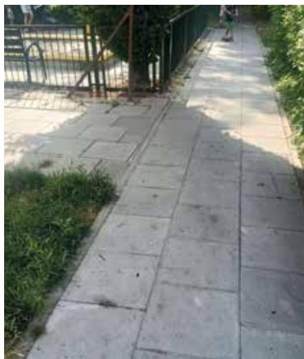
ul. Siedleckiego 13 (wewnętrzny) - PO

przygotowuje harmonogram prac na najbliższy rok. Drobne naprawy wykonywane są na bieżąco w ramach interwencji zgłaszanych przez radnych do Zarządu Dróg.