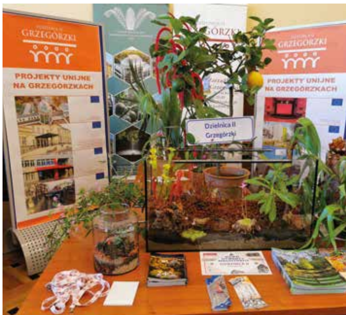
Stoisko Rady Dzielnicy II podczas Dnia Magistratu