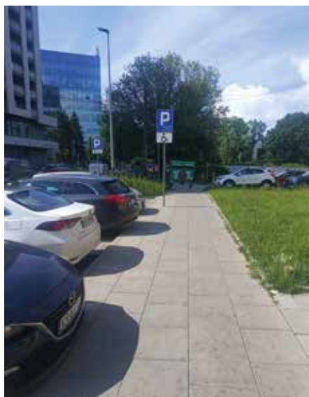
ul. Rogozińskiego 5 - PO

Trwający właśnie sezon remontowy to doskonała okazja, aby przybliżyć Państwu wkład Rady Dzielnicy w poprawę wygody i bezpieczeństwa naszych codziennych spacerów.