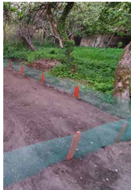
Początki ogrodu społecznego (maj 2022).