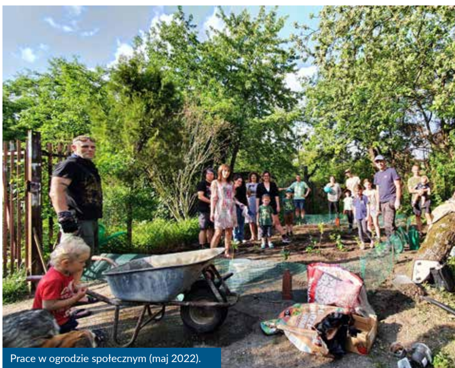
Prace w ogrodzie społecznym (maj 2022).