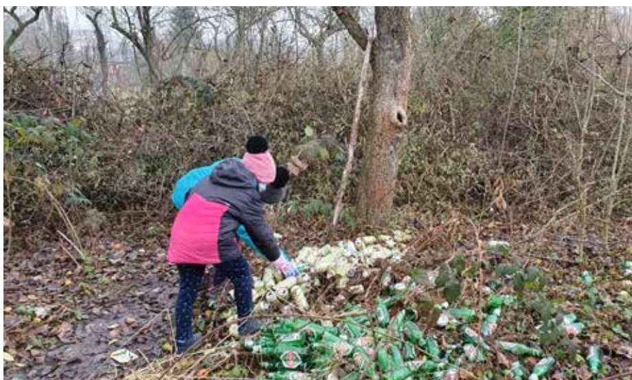
Ogromne ilości śmieci pozostawione przy ścieżce wzdłuż Białuchy (stan w 2020 roku).

Mieszkańcy próbowali różnych sposobów na zainteresowanie problematycznymi działkami. W kwietniu 2022 odbyła się druga akcja sprzątnięcia Bulwarów Białuchy. Z uwagi na zimowe warunki panujące w umówiony dzień mieszkańcy i wolontariusze postanowili posprzątać m.in. jedną prywatną działkę, która nie była użytkowana