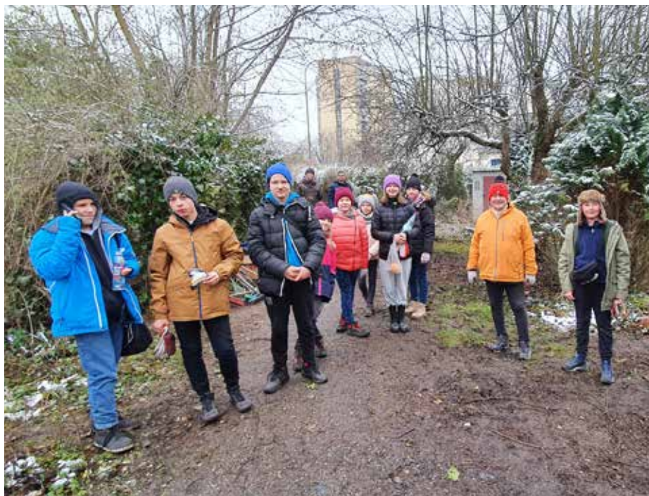
Uczestnicy akcji sprzątania Bulwarów Białuchy na terenie prywatnych działek (kwiecień 2022).

We wrześniu 2024 przyszła do Rady Dzielnicy II niesamowita