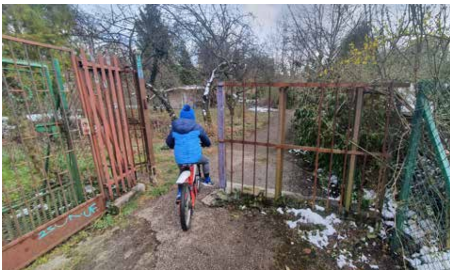
Ogrodzenie na środku ścieżki wzdłuż Białuchy (kwiecień 2022).